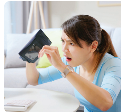
Loss of savings