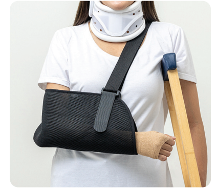
Kos perbelanjaan perubatan yang tidak dijangka